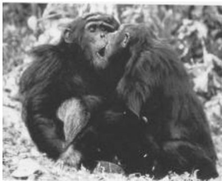
Schimpansenpaar, Begrüßung durch Küsse nach längerer Trennung

freiwillig gewährt werden. Wieder beruhigt durch gütliches Zureden und Liebkosungen, gestattete der Leidende ohne Widerstreben eine nochmalige Untersuchung der Halsgeschwulst und leitete auch diesmal bittenden Blickes meine Hand. Dies musste uns ermutigen, eine Operation ohne Hilfe betäubender Mittel und ohne jegliche Fessel zu wagen. Auf dem Schoße seines Pflegers sitzend, beugte der Affe den Kopf rückwärts und ließ sich willig in dieser Stellung festhalten. Die erforderlichen Schnitte waren rasch geführt; das Tier zuckte weder, noch gab es einen Laut des Schmerzes von sich. Eine Menge dünnflüssigen Eiters quoll hervor, und mit seiner Entleerung schwand die