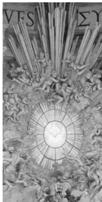
Altar im Petersdom, Rom

Wir müssen daher zulassen und ermöglichen, dass es seiner Art, seiner Natur und seiner ihm innewohnenden Gesetzmäßigkeit entsprechend leben kann. Wir müssen ihm den Lebensraum zubilligen, in dem es seiner Art und seiner Natur entsprechend in Harmonie mit der Natur leben kann. Wir dürfen dem Tier weder Schmerz noch Leid zufügen. Wir dürfen Tiere nicht töten.