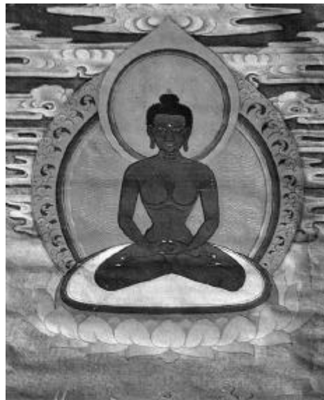
Tibetische Darstellung, Adibuddha

Die Menschen der gesetzgebenden Institutionen gestehen allein schon durch diese Formulierungen zu, dass Tiere Geschöpfe eines Schöpfers sind und dass Tiere in der Lage sind, Empfindungen zu verspüren, wie Schmerzen und Leiden. Allein das Wort Geschöpf führt unweigerlich auf religiöses und metaphysisches Terrain. Die Fähigkeit Schmerzen und Leiden zu empfinden unterstellt Psyche und Bewußtsein und führt somit zum Thema Seele, bzw. in unserem speziellen Fall zur Frage, ob Tiere eine Seele haben.