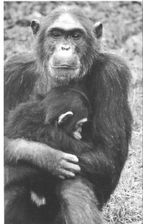
Schimpansemutter mit Kind

Das apathische Tier lag krank mit einer Lungenentzündung, geschwollenen Lymphdrüsen des Halses und einer eiternden Geschwulst unterhalb des Kehlkopfes in seinem Gehege. Der Arzt schreibt: „Das beklagenswerte Geschöpf schien sich dieser Geschwulst als Atmungshindernisses bewusst zu sein; wie bräunekranke Kinder in ihrem Lufthunger nach dem Sitze des Leidens fassen, so führte der Schimpanse meine untersuchende Hand, als erwarte er in dunkler Ahnung von dieser Hilfe, immer und immer wieder zur Halsgeschwulst zurück. – Nach vorgängiger Beratung mit einem Berufsgenossen wurde die Öffnung des Senkungsgeschwürs durch einen Schnitt in der Höhe des Kehlkopfes als dringend notwendig erkannt. Leicht gefunden war dieser Rat, schwierig die Art und Weise der